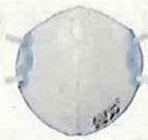
使い捨て式防じんマスク

がれきの粉じんには石綿が含まれているおそれがあります。事業者の指示に従い、適切なマスクの着用をお願いいたします。