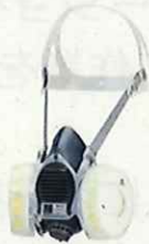
取替え式防じんマスク