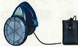
電動ファン付き呼吸用保護具